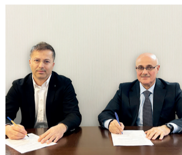
Национальная академия авиации при ЗАО Azerbaijan Airlines (AZAL) подписала меморандум о сотрудничестве с турецким Университетом Каппадокии.

Национальная академия авиации совместно с Университетом Каппадокии будет готовить специалистов для AZAL