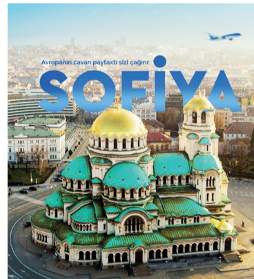
Национальный авиаперевозчик Азербайджана AZAL с 7 июня начнет выполнять полеты из Баку в Софию и обратно дважды в неделю, сообщила БР пресс-служба авиаперевозчика.

AZAL открывает рейсы из Баку в столицу Болгарии