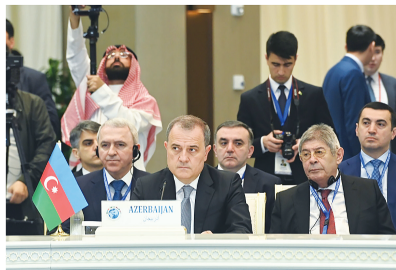
Министр иностранных дел Азербайджанской Республики Джейхун Байрамов 15 апреля в рамках рабочего визита в Республику Узбекистан принял участие в качестве почетного гостя и выступил на втором министерском заседании Стратегического диалога «Центральная Азия - Совет сотрудничества арабских государств Персидского залива (ССАПЗ)».

Джейхун Байрамов: Армения должна ответить взаимностью на усилия Азербайджана по миру и созиданию