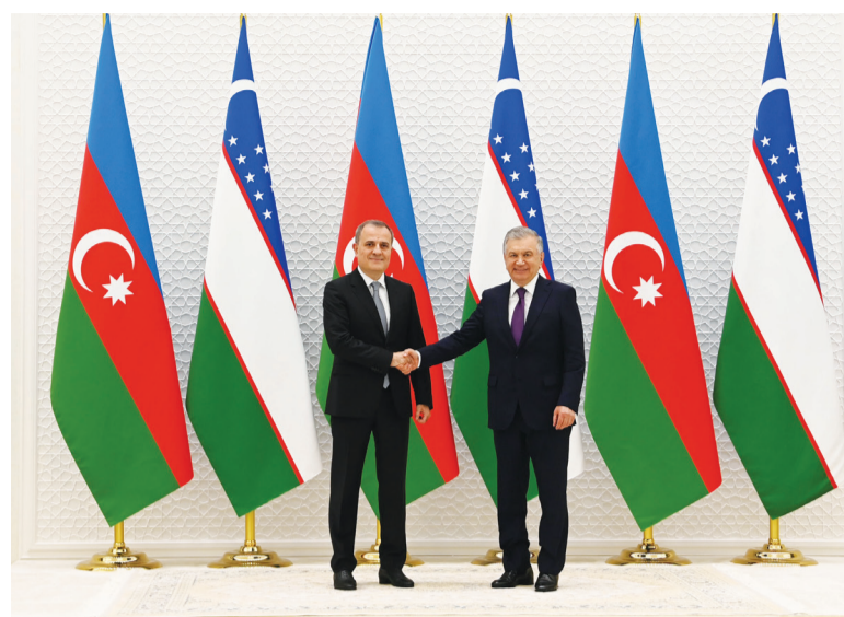
15 апреля министр иностранных дел Азербайджана Джейхун Байрамов в рамках рабочего визита в Республику Узбекистан встретился с Президентом Шавкатом Мирзиёевым.

Министр иностранных дел Азербайджана встретился с Президентом Узбекистана