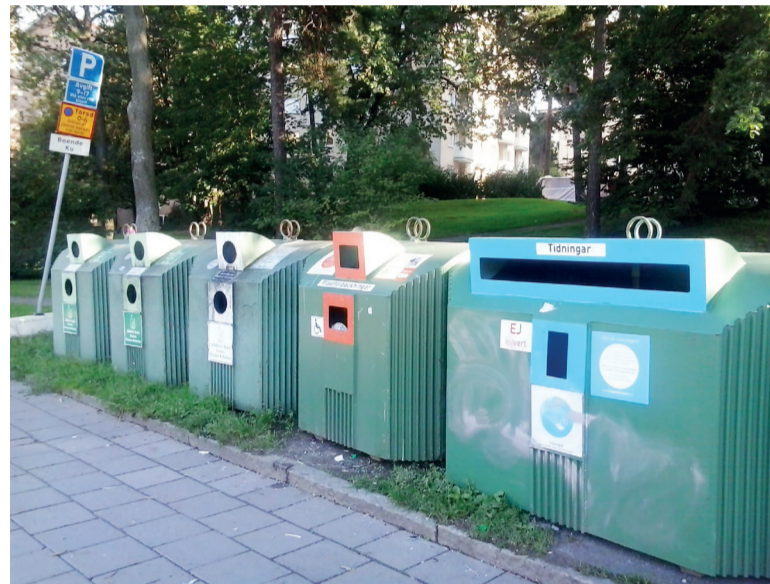
Стокгольм. Специальная площадка для утилизации крупногабаритных отходов

Здесь же можно будет показать образцы мусорных контейнеров, чтобы люди воочию увидели, что в Европе, например, установлены контейнеры для разных видов твердых отходов. Это пластик, стекло, металл, бумага и картон, а также батарейки и текстиль. Например, в одной из самых продвинутых стран в области утилизации отходов - Швеции муниципалитеты оборудовали специальные площадки, где жители могут складировать крупногабаритные отходы, такие как стиральные машины, холодильники, телевизоры и др. Кстати, у нас есть подходящая