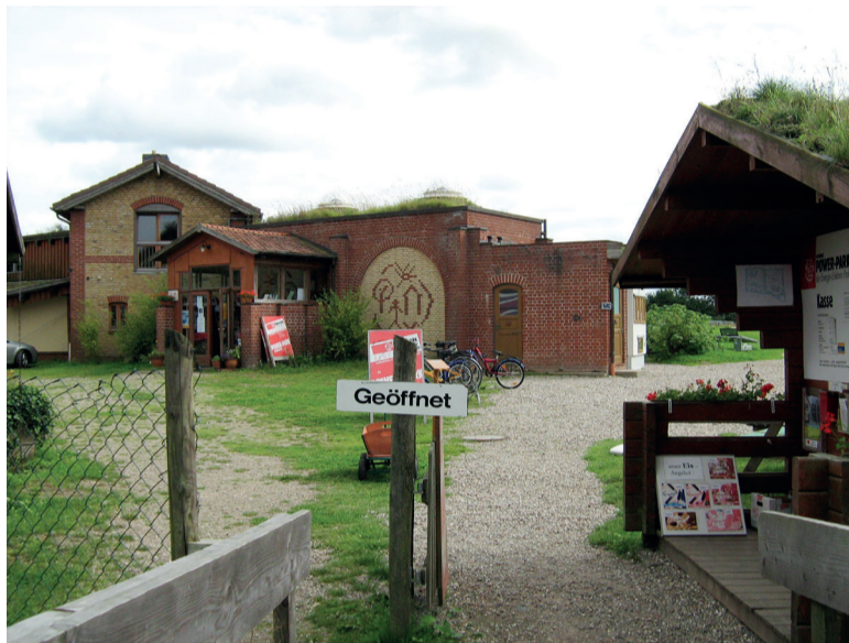
Гамбург. Экодеревня, где собраны образцы экологически чистого оборудования

в пасмурную погоду. Солнечные технологии дарят тепло, охлаждение, естественное освещение, электричество и топливо для большой сферы применения. Эти технологии позволяют преобразовывать солнеч-